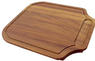
Tagliere in legno Iroko 8655 000