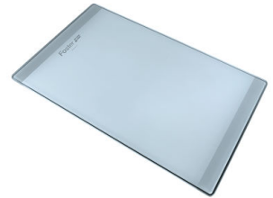
Tagliere in cristallo 8631 300