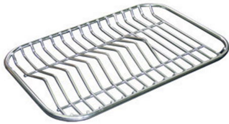
Griglia portapiatti inox 8100 280