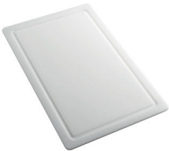
Tagliere in HPDE 8657 001